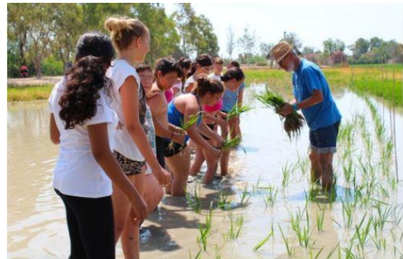
Safari EcoCultural en Delta del Ebro