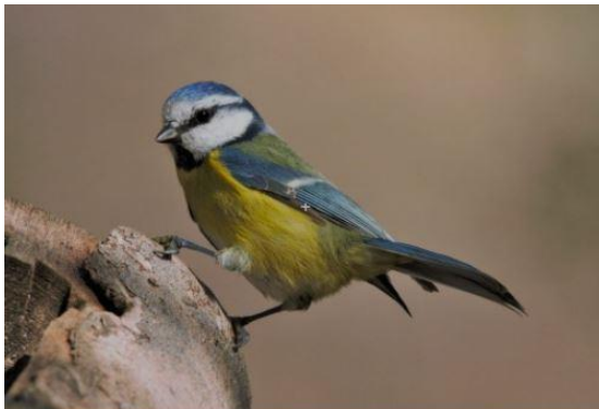
Iníciate en la Ornitología en Huesca