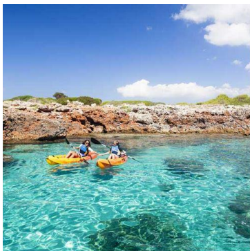
Menorca Reserva de Biosfera