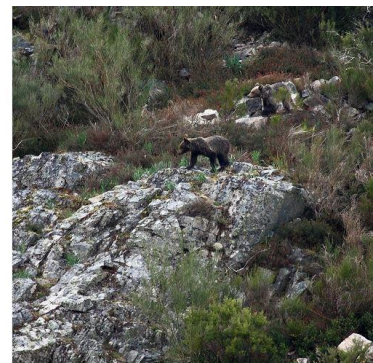
Muniellos – Fuentes del Narcea