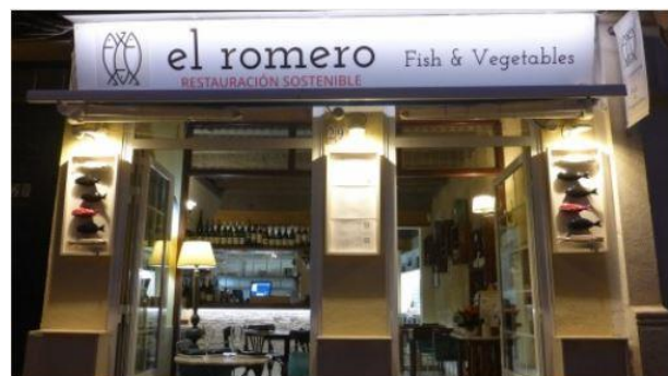
El Romero restauración sostenible