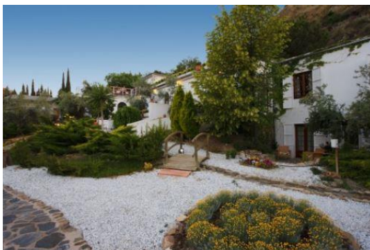
La Almunia del Valle Boutique Hotel